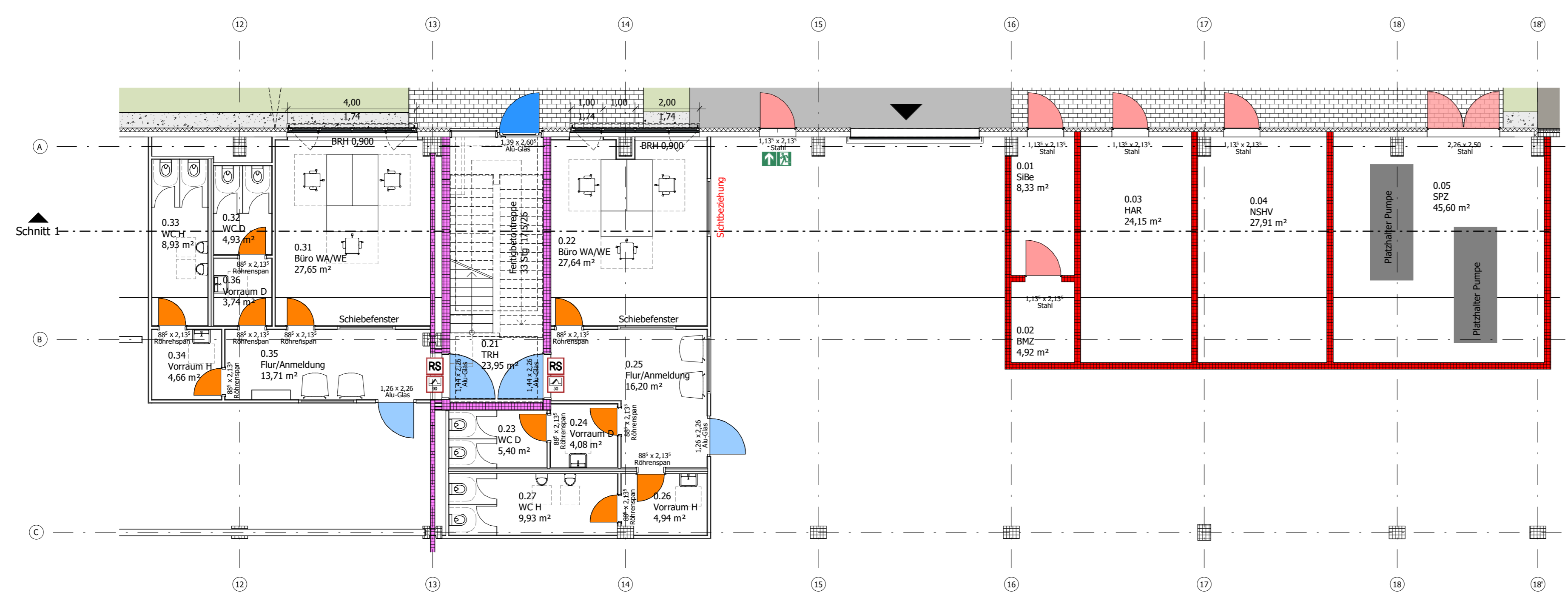
Einbau EG Unit 2/3