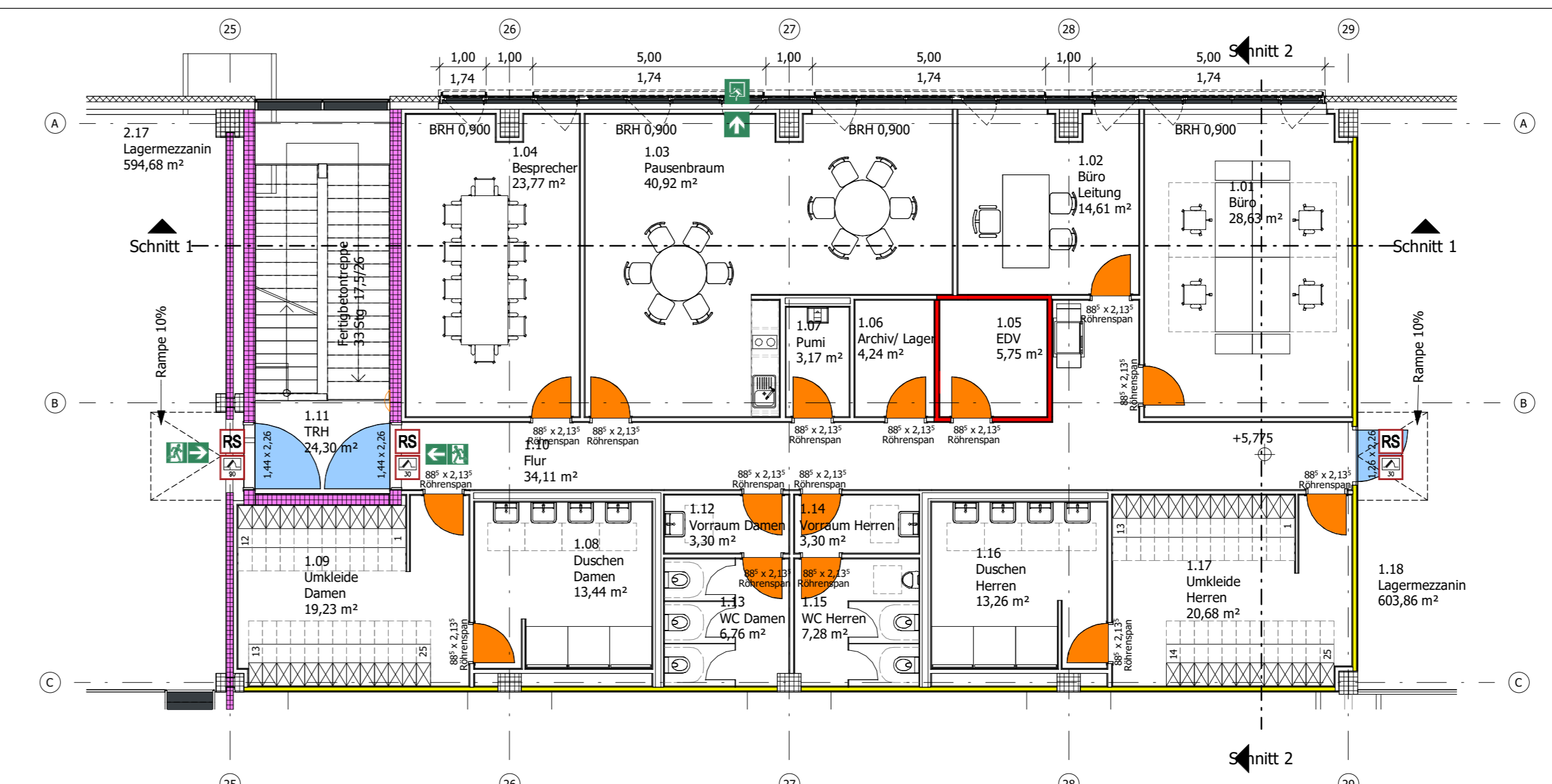
Mezzanin Unit 1